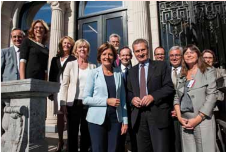
Der rheinland-pfälzische Ministerrat mit EU-Kommissar Günther Oettinger bei einem Treffen in der Landesvertretung Rheinland-Pfalz in Brüssel.

rahmen für die Europäischen Union für die Jahre nach 2020, die Zukunft der wichtigen europäischen Programme, von denen das Land profitiert, wie z.B. EFRE, ELER, ESF und Interreg, aber auch die Direktzahlungen in der Landwirtschaft sowie Direktprogramme im Bereich der Forschung wie Horizon 2020 oder der Bildung wie Erasmus+. Daneben bündelt der Plan diverse fachpolitische Anliegen, beispielsweise in den Bereichen europäische Steuerpolitik, Digitalisierung, aber auch Katastrophenschutz.