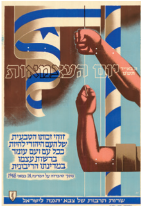
1949 - Der Unabhängigkeitstag und der Tag des Gedenkens, Yohanan Simon

Jeder der in der Ausstellung gezeigten Entwürfe repräsentiert ein Jahr in der Geschichte des 1948 gegründeten Staates. Der Bogen spannt sich von Krieg und Frieden über Politik, Religion, Landwirtschaft und Bildung bis hin zu Gesundheit und Sport. Die ungewöhnliche Materialsammlung macht deutlich, wie sehr Israels Geschichte die Entwicklung des Designs bis heute beeinflusst und vermittelt einen völlig neuen Zugang zu Kunst und Kultur, Geschichte und Gesellschaft in Israel.